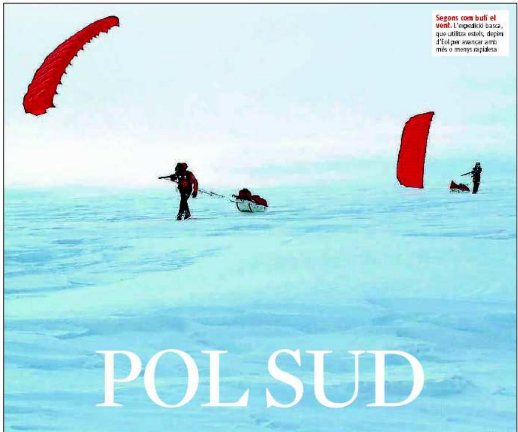
Segons com bufi el vent, l'expedició basca, que utilitza estels, depèn d'Eol per avançar a més o menys rapidesa